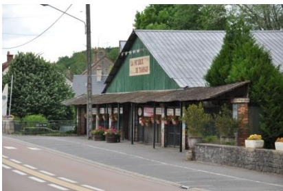
Le grand hangar de 700m 2