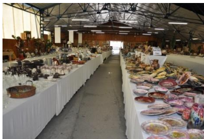
L'intérieur du hangar