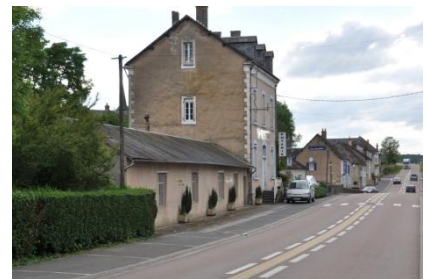
La bâtisse en pierre